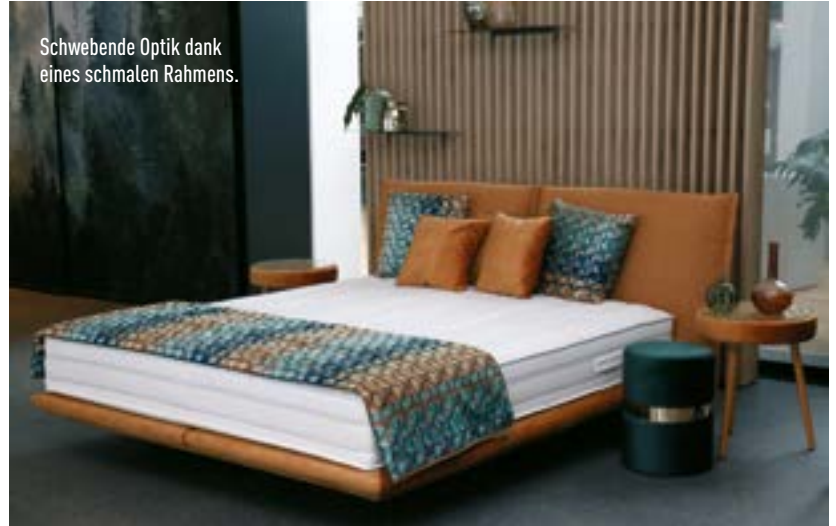
Schwebende Optik dank eines schmalen Rahmens.