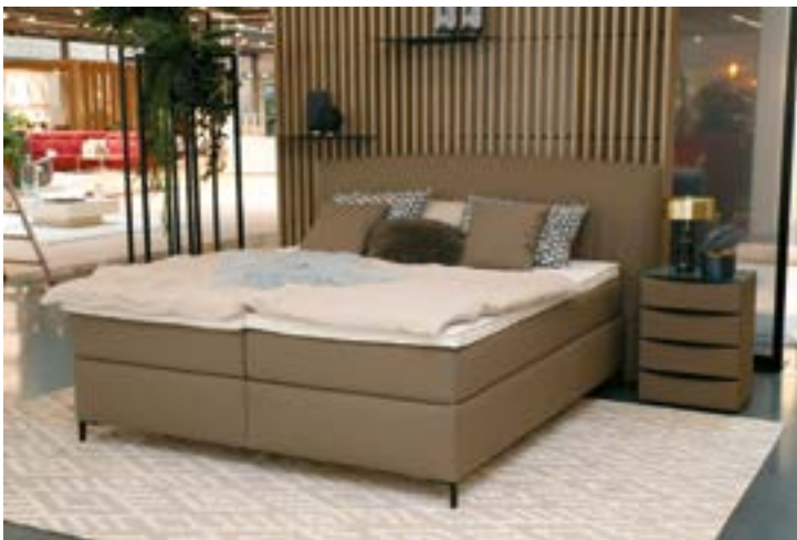
„Dream Solution“ heißt das System von Oschmann Comfortbetten, das kaum Wünsche offen lässt. Selbst diese Auswahl von nur drei Modellen zeigt anschaulich, was das Konzept, das sowohl Boxspring-, als auch Polsterbetten möglich macht, alles bietet.