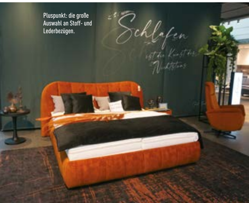
Pluspunkt: die große Auswahl an Stoff- und Lederbezügen.