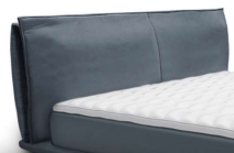
KT 0809 Höhe 76 cm